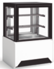
Gelados Ice Cream