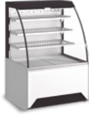
Grab & Go