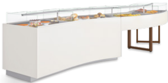
Vitrinas Display cases