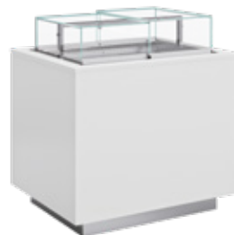
IMINS - VDB UV Ilha Island